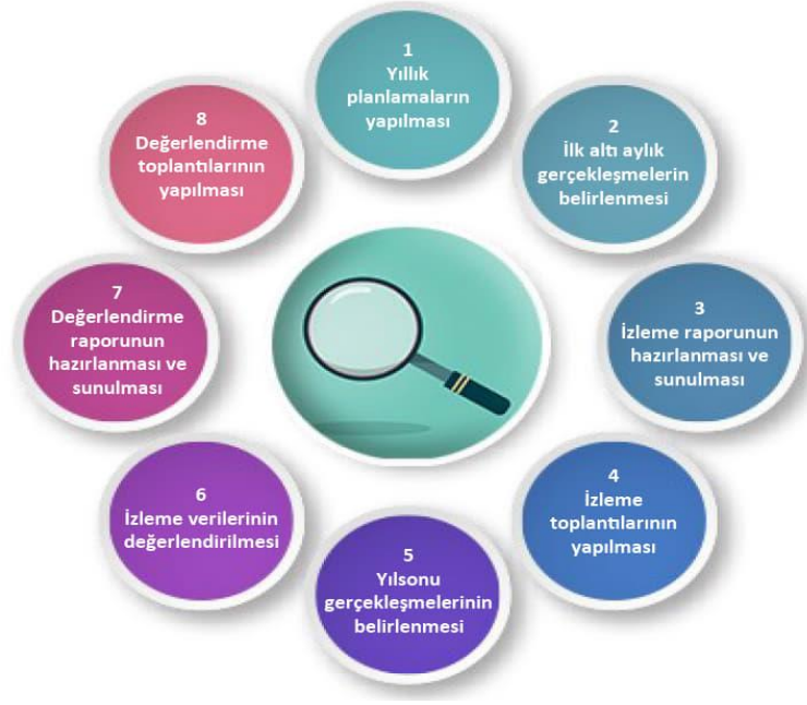
Şekil-2 İzleme ve Değerlendirme Süreci

İzleme ve değerlendirme sürecinin işleyişi ana hatları ile yukarıdaki şekilde özetlenmiştir.